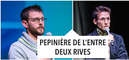
PEPINIÈRE DE L'ENTRE DEUX RIVES