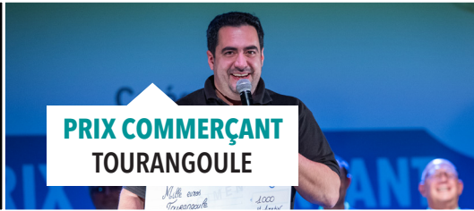
PRIX COMMERÇANT TOURANGOULE