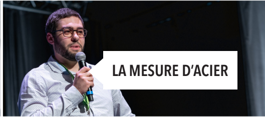
LA MESURE D'ACIER