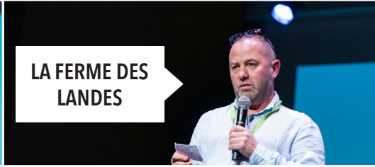
LA FERME DES LANDES