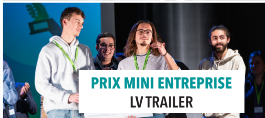
PRIX MINI ENTREPRISE LV TRAILER