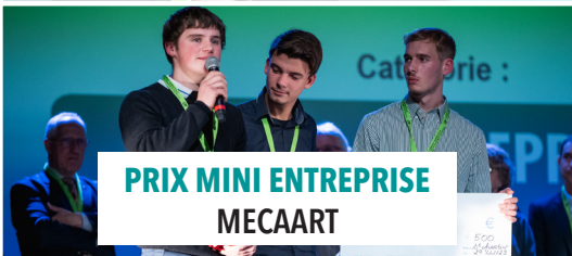
PRIX MINI ENTREPRISE MECAART