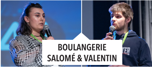
BOULANGERIE SALOMÉ & VALENTIN